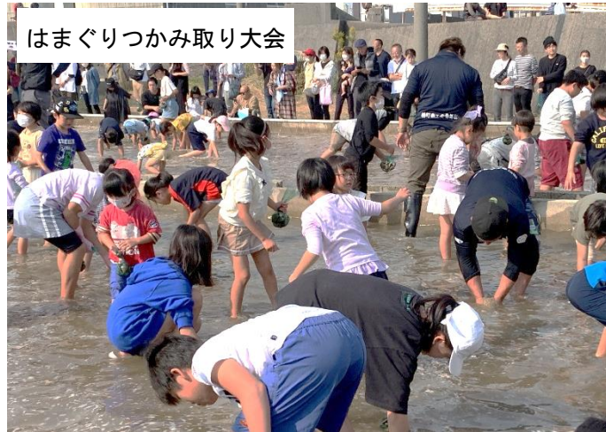
はまぐりつかみ取り大会