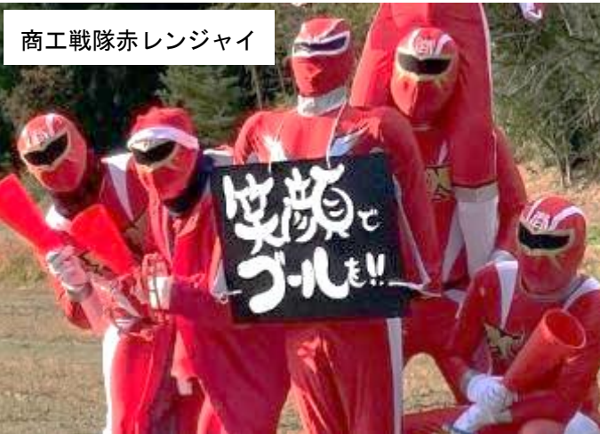
商工戦隊赤レンジャイ